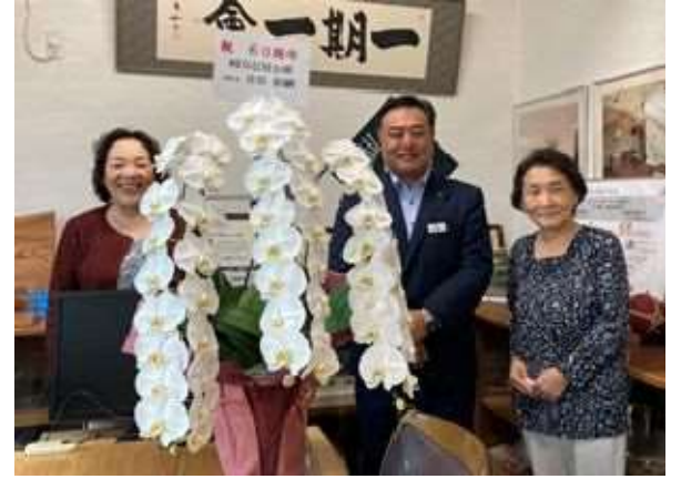
岐阜信用金庫 支店長様