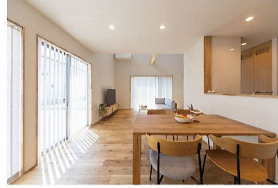
幸の家 (THE ONLY)