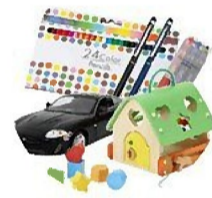
文房具・おもちゃ