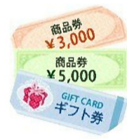
商品券・ギフト券